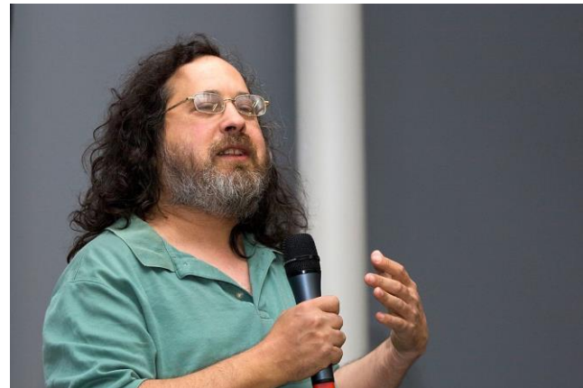
Richard Stallman